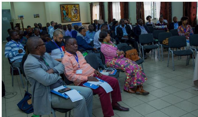
Ensemble des participants dans la salle

Au-delà des interventions menées individuellement par chaque programme, les intervenants et participants de cette journée ont mis en évidence la nécessité de créer des mécanismes de remonte et partage des informations avec le secteur . En premier lieu, dans une optique de poursuite des objectifs stratégiques partagés, il est important d'en assurer le suivi systématique à travers une base de données commune. Un processus d'intégration des villages appuyés par des acteurs en-dehors du PNEVA dans la base de données nationale des villages assainis est tout à fait en cours et représente un objectif prioritaire pour nous du Consortium WASH RDC.