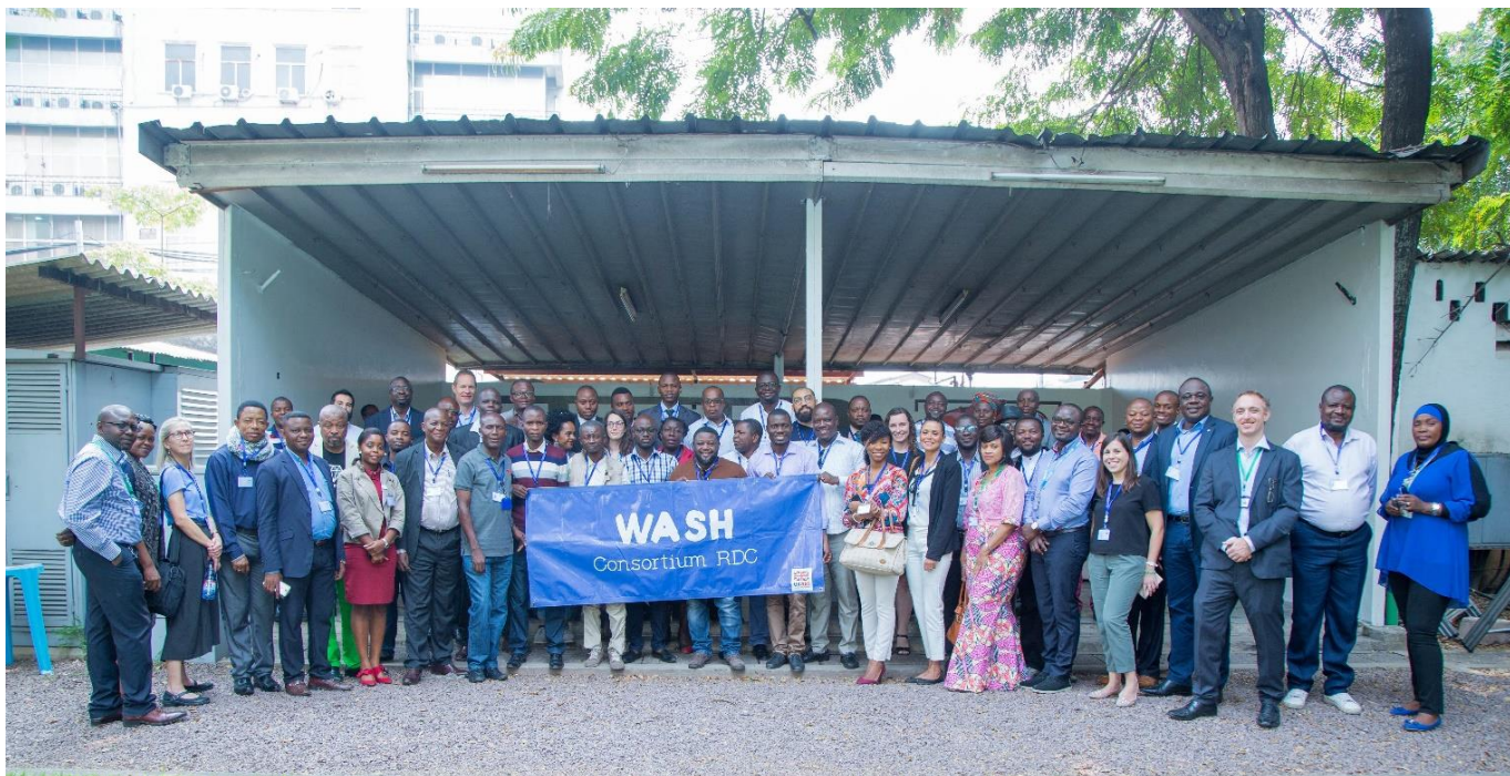
Les participants à la 8ème Revue Technique